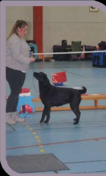
Eier: Sven Slettedal