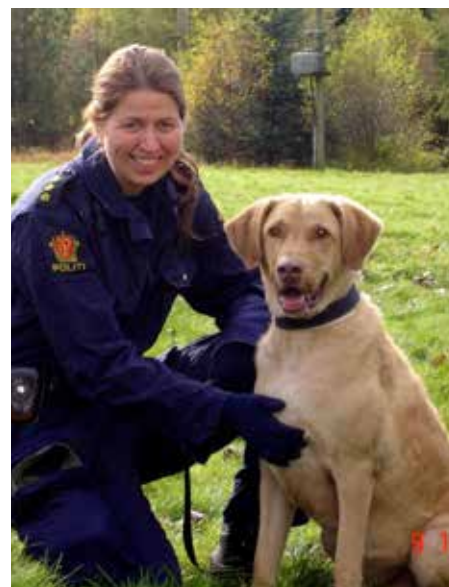
Aquamanda's Highlander -"Wiggly"