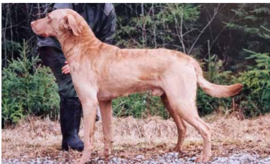
Tatanka Iytake, -"Reidar"-