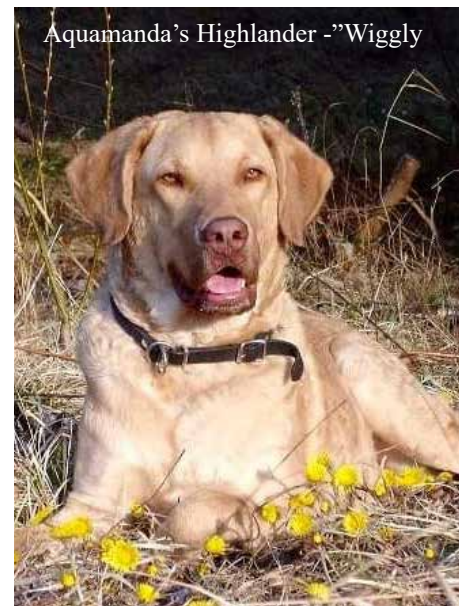
Aquamanda's Highlander - "Wiggly"