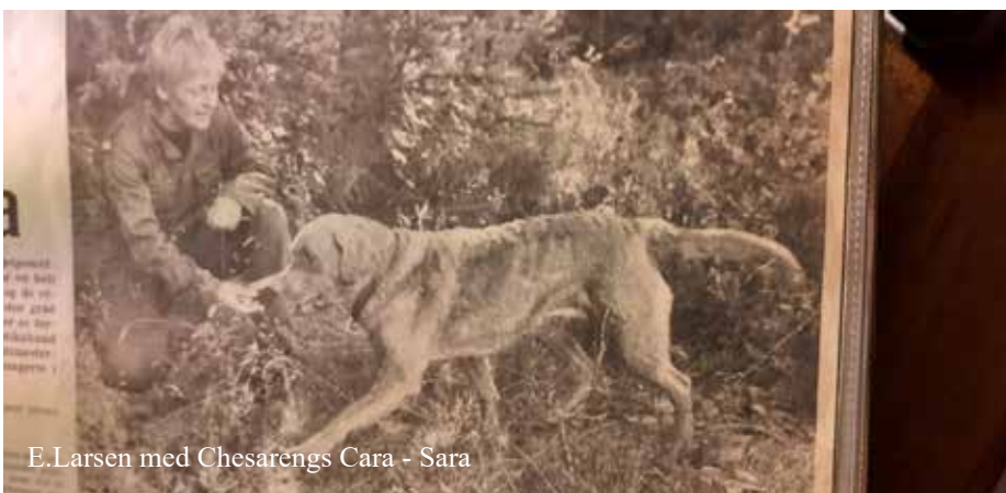
E.Larsen med Chesarengs Cara - Sara