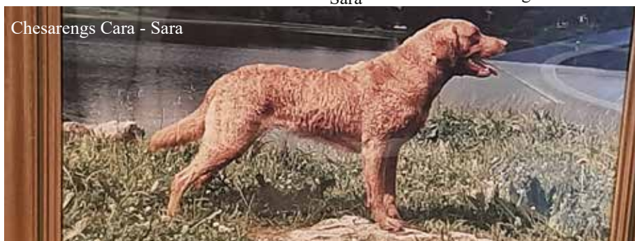
Chesarengs Cara - Sara