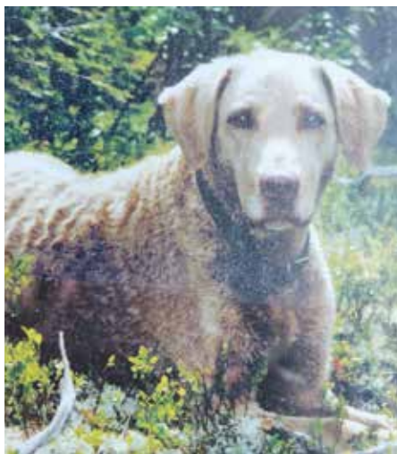
Americana - "Rikke",