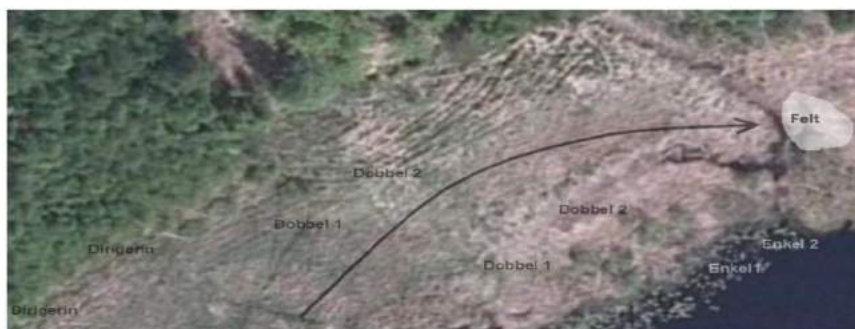
Figur 4- Eksempel på skisse fra flybilde av prøveområdet

Felt: felt i et begrenset krattområde. Fem vilt i feltet.