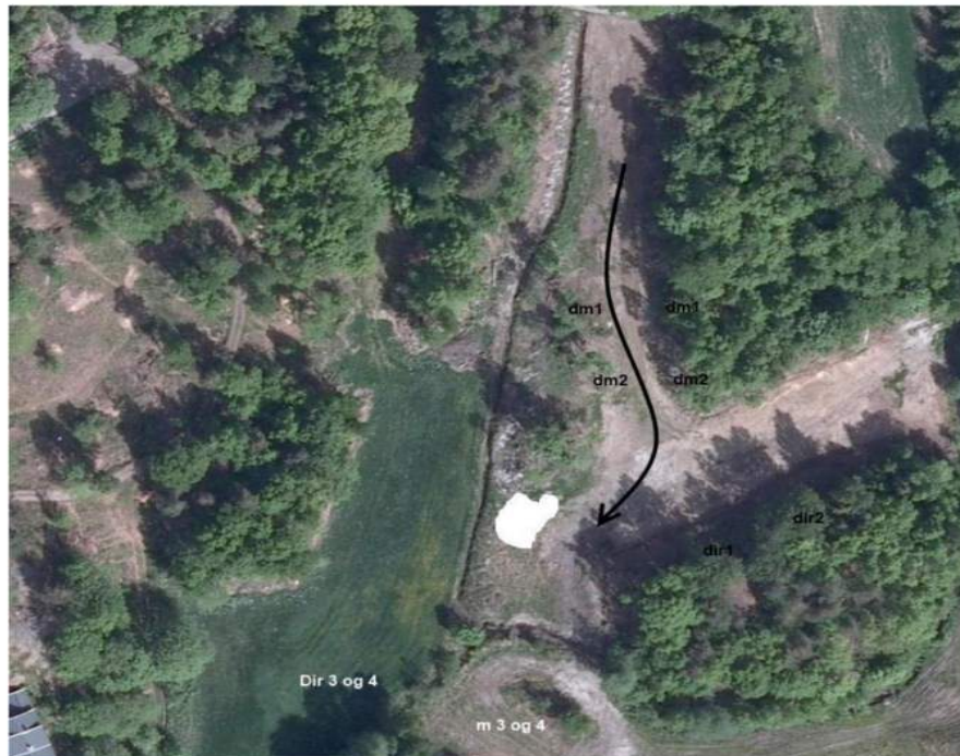
Figur 3 - Eksempel på skisse fra flybilde av prøveområdet