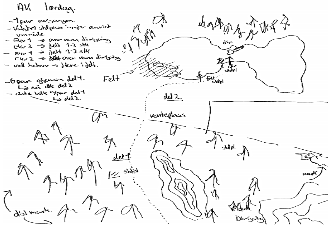
Figur 1 - Eksempel på håndtegnet skisse