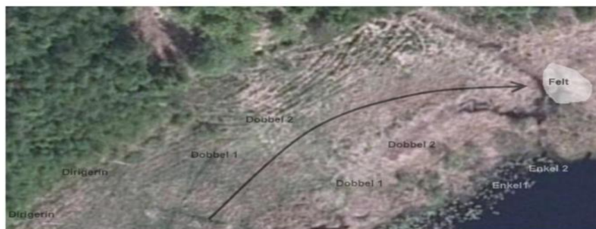
Figur 4- Eksempel på skisse fra flybilde av prøveområdet

Felt: felt i et begrenset krattområde. Fem vilt i feltet.